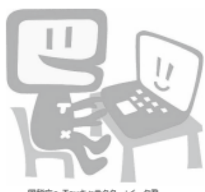
国税庁e-Taxキャラクター：イータ君